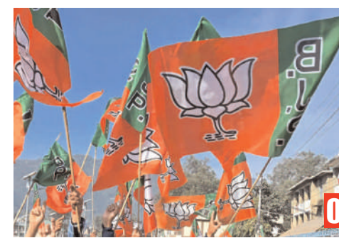
నేడు బజ్జి మేనిఫెస్టో విడుదల

సంపుటి: 14, సంచిక: 09, పేజీలు 8, వెల: 4.00