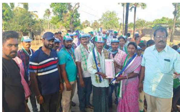
జన్మభూమి కమిటీలకు మాత్రమే ప్రభుత్వ లబ్ధి అందుతుంది తప్ప నిజమైన నిరుపేదకు ఏ మాత్రం అందదని స్పష్టం చేశారు. ఏ నాడైనా సింగిల్ గా టీడీపీ పోటీ చేయలేదన్నారు. ఒకసారి ఎన్నికై తోను, మరొకసారి వాళ్ల పార్టీ ను వట్టుకుని, ఆ తరువాత మోదీని పట్టుకుని