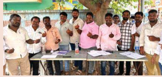
జిల్లెలగూడకు చెందిన కమలానగర్ నగర్ కాలనీ సహభారత్ యాత్ సభ్యులు బాతు నెంబర్ 141 లో తమ ఓటు హక్కును వినియోగించుకున్నారు.