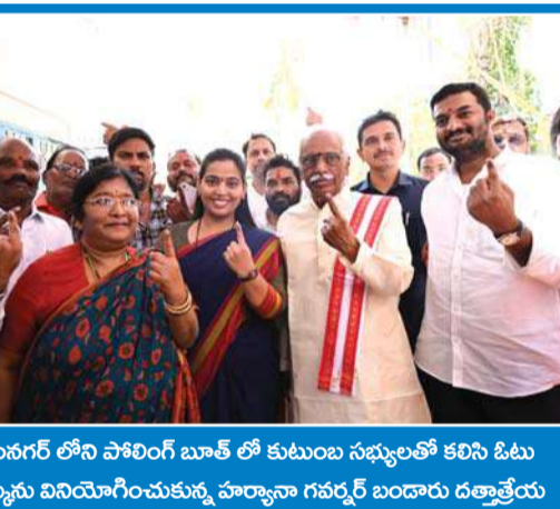
రాంబగల్ లోని పోలింగ్ బూత్ లో కుటుంబ సభ్యులతో కలిసి ఓటు హక్కును వినియోగించుకున్న హరిజన గవర్నర్ బండారు దత్తత్రయ