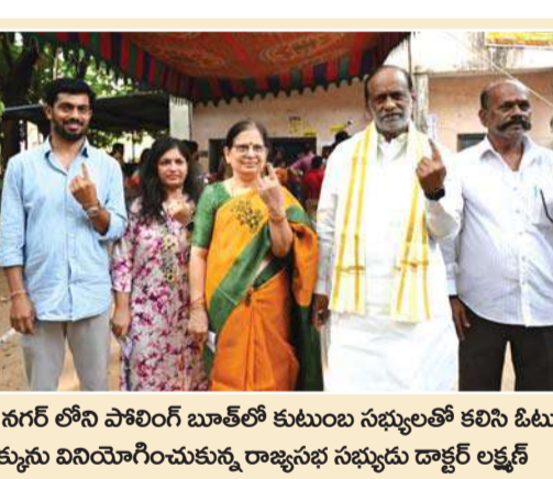
అతోక్ నగర్ లోని పోలింగ్ బూత్ లో కుటుంబ సభ్యులతో కలిసి ఓటు హక్కును వినియోగించుకున్న రాజ్యసభ సభ్యుడు డాక్టర్ లక్ష్మణ్