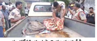
మృతదేహాలను ఉన్నాయి మాన్యువల్ తరలించు పోలీసులు