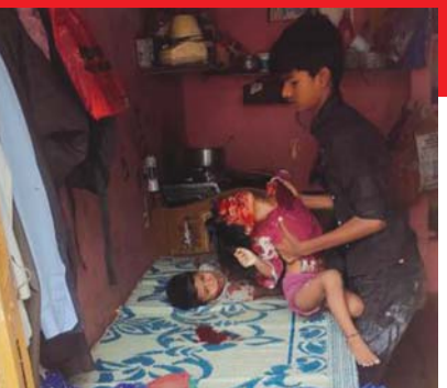
ప్రమాదంలో గాయపడిన చిన్నారులు

చేశారు. ఈ మేరకు ఘటన స్థలాన్ని ఆయన మున్సిపల్ అధికారులు నిబ్బం దిశో కలిసి పరిశీలించారు. ఘటన జరిగిన తీరును అడిగి తెలుసుకున్నారు. సర్కిల్ పరిధిలో ఎక్కడైనా పురాతనమైన నివాసయోగాలు ఉంటే వాటిని తక్షణమే తొలగించేందుకు కార్యచరణ రూపొందించే ముందుకు వెళితామని అన్నారు. అలాగే వర్షాకాలం నేపథ్యంలో లోతట్టు ప్రాంతాలు జలమయం అవుతున్నా అలాగే ప్రధాన రహదారులపై వర్షపు నీరు నిలవకుండా తగిన చర్యలు తీసుకుంటున్నామని మాన్యువల్ డీ అందుబాటులో ఉంటుందన్నారు. ఎక్కడైనా శిథిలావస్థకు చేరిన నివాసయోగాలు ఉంటే తమ దృష్టికి వెంటనే తీసుకురావాలని ఆయన ప్రజలను కోరారు.