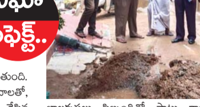
బాలకృష్ణులు నిబ్బందితో పాటు కాలనీని సందర్శించారు. నల్లాలలో కలుషిత నీళ్లు ఎందుకు వస్తున్నాయో దానిపై జలమండలి నిబ్బంది చెక్ చేయగా, కాలనీలోని ఓ ఇంటికి సంబంధించిన సెవర్ లైన్ లైన్ వద్దనుండి వచ్చే నల్లాలలో కలుషితమైన నీరు సరఫరా అవుతున్నట్లు గుర్తించి నిబ్బంది మరమ్మతులు చేపట్టారు. తమ సమస్య పరిష్కారానికి కృషి చేసిన నిఘా దినపత్రికకు కాలనీవాసులు ధన్యవాదాలు తెలిపారు.

బాగ్ అంబర్ పేట్, జూన్ 3 (నిఘా న్యూస్): నిఘా తెలుగు జాతీయ దినపత్రిక పత్రికలో వచ్చిన వార్త కథనానికి అంబర్ పేట్ (అడికెట్) జలమండలి సబ్ డివిజన్ అధికారులు స్పందించారు. బాగ్ అంబర్ పేట్ స్ట్రీట్ నెంబర్ 15 గత రెండు నెలలుగా నల్లాలలో కలుషితమైన నీరు సరఫరా అవుతుంది. దీంతో కలుషిత నీరు కాలనీలోని చాలామంది వాంతులు విరోచనాలతో, చర్మ వ్యాధులతో బాధపడుతున్నారు. ఈ విషయమై ఫిర్యాదు చేసిన జలమండలి అధికారులు పట్టించుకోవడం లేదు. దీనిపై స్థానిక కాలనీ వాసులు జాతీయ దినపత్రికకు సమాచారం అందించారు. 'విషం తాగుతున్నారని నిమిషం ఇటు చూడండి' అనే శీర్షికతో సోమవారం నిఘా దిన పత్రికలో వార్త కథనం ప్రచురితమైంది. దీనిపై స్పందించిన జలమండలి జనరల్ మేనేజర్ రామకృష్ణ, డిజిఎం విష్ణువర్ధన్ రావు, పర్సన్ ఇన్చార్జ్