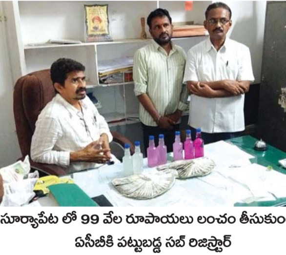
సూర్యాపేట లో 99 వేల రూపాయలు లంచం తీసుకుంటూ ఏసీబీకి పట్టుబడ్డ సబ్ రిజిస్ట్రార్

ఐదు నుండి 18 సంవత్సరాల వయసు వారు అర్హులు రాజస్థాన్ సిలసిల్ల జిల్లా సంక్షేమ అధికారి ముస్తాబాద్/ సిరిసిల్ల, జూన్ 3 (నిఘా న్యూస్): రాజస్థాన్ సిలల్ల జిల్లాలోని ప్రతిభా వంతులైన పిల్లలను సత్కరించేందుకు భారత ప్రభుత్వం బాలబాలికలకు ప్రధానమంత్రి రాష్ట్రీయ బాలపురస్కార-2024 అవార్డులను అందజేయటం గాను ధరభాస్సులను స్వీకరిస్తుంది. ఇల్లి అవార్డులను నిన్నార్యమైన సేవలు చేసిన యువ బాలబాలికల వ్యక్తిగత, సంస్థలకు ఇవ్వబడును. ఇల్లి ధరభాస్సులకు ఐదు నుండి 18వ సంవత్సరముల వయస్సు లోపు గల బాలబాలికలు అర్హులు. డైరెక్టోరియా, క్రీడలు, సామాజిక సేవ, సైన్స్ అండ్ టెక్నాలజీ, పాఠశాల, కళలు, సాంస్కృతిక తదితర రంగాలలో ప్రతిభ కనపరచిన బాలబాలికలు, సంస్థలు వారి ధరభాస్సులను జూలై 31వ తేదీ లోపల https://awards.gov.in వెబ్ సైట్ నందు ధరభాస్సు చేసుకోగలరని జిల్లా సంక్షేమ అధికారి ఒక ప్రకటనలో తెలిపారు. మిగిలి వివరాలకు జిల్లా కలెక్టర్లో కార్యాలయంలోని జిల్లా సంక్షేమ అధికారి, మహిళలు, పిల్లలు, వికలాంగులు, వయోవృద్ధుల శాఖ, రాజస్థాన్ సిలసిల్ల జిల్లా కార్యాలయంలో సంప్రదించాలని కోరారు.