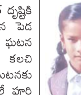
మృతి చెందిన చిన్నారు (ఫైల్)

వలమూర్తి మేయర్ దృష్టికి తీసుకెళ్లి వివరించిన పెడ చెవిన పెట్టారని ఈ ఘటన వేసినందు ఈ ఘటనకు బద్దీయా అధికారులే పూర్తి బాధ్యత వహించాలని కార్పొరేటర్ అన్నారు. అలాగే రాష్ట్ర ప్రభుత్వం బాధ్యులను ఆదుకొని నష్టపరిహారాన్ని చెల్లించాలని ఆయన డిమాండ్ చేశారు.