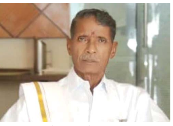
కుటుంబానికి ప్రణాళి సానుభూతి తెలిపారు.