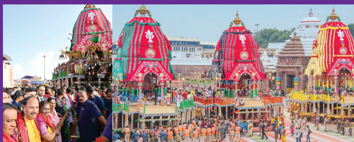
పూర్ణ జూలై 7 (నిఘా స్పూస్): ఒడిశాలోని పూర్ణ జగన్నాథుని విశ్వప్రసిద్ధ రథయాత్ర భక్తుల జయ ద్వానాల మధ్య ఆదివారం సాయంత్రం వైభవంగా ప్రారంభమైంది. ఒడిశాలో పాటు దేశం నలుమూలల నుంచి భారీ సంఖ్యలో భక్తులు రథయాత్రను వీక్షించేందుకు తరలి రావడంతో పూర్ణ పట్టణం మిగతా 2లో..