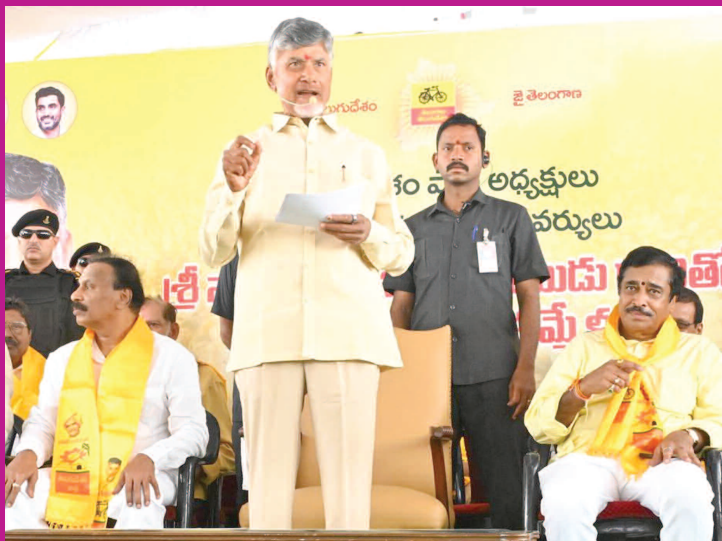
హైదరాబాద్ జూలై 7 (నిఘా స్పూస్): తెలుగు రాష్ట్రాల ప్రజలు కలిసి ముందుకొస్తే టీడీపీని బలోపేతం చేస్తామని చంద్రబాబు నాయుడు అన్నారు. రెండు రాష్ట్రాలు గొడవలు పెట్టుకుంటే నీళ్ల రావని, సమస్యలు పరిష్కారం కావని, అభివృద్ధి జరగదని తెలిపారు. ఏటీ సీఎంగా బాధ్యతలు స్వీకరించిన అనంతరం హైదరాబాద్ లోని ఎన్టీఆర్ భవన్ కు చంద్రబాబు తొలిసారిగా వచ్చారు. ఈ సందర్భంగా మిగతా 2లో..

తెలుగు రాష్ట్రాలు నాకు రెండు కళ్లు ఎన్టీఆర్ భవన్ లో చంద్రబాబు వ్యాఖ్యలు