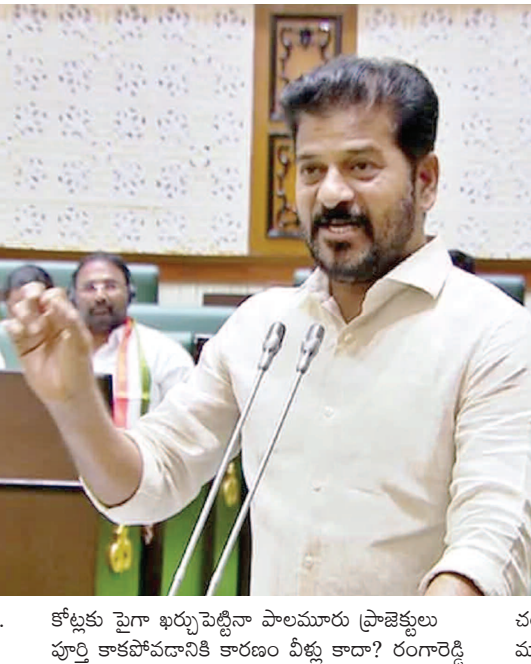
కోట్లకు రాగా భువిపెట్టినా పాలమూరు ప్రాజెక్టులు పూర్తి కాకపోవడానికి కారణం ఏళ్లు కాదా? రంగారెడ్డి

ఉకడంపుడు ఉపన్యాసం ఇస్తున్నారన్నారు. ప్రజలను మళ్ళీ పెట్టాలని చూస్తే వారు సమ్మదానికి సిద్ధం లేరని చెప్పారు.