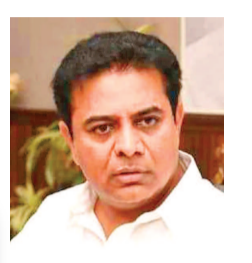
కేటీఆర్ జైలుకేళ్లడం ఖాయం