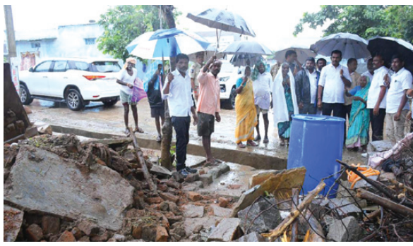
చేస్తామని హామీ ఇచ్చారు. ఈ కార్యక్రమంలో మండల కాంగ్రెస్ పార్టీ నాయకులు తదితరులు పాల్గొన్నారు.

పెట్టేరు, సెప్టెంబర్ 1 (నిఘా న్యూస్): నాలుగు రోజులుగా కురుస్తున్న వర్షాలతో శిథిలావస్థలో ఉన్న ఇళ్ల కూలుతున్నాయి. పెట్టేరు మున్సిపాలిటీలోని 1 వార్డులో దేవమ్మ పాత ఇల్లు కావడంతో ప్రమాదకరంగా ఉండడం, ఆ గదిలో ఎవరూ లేక పోవడంతో పెద్దప్రమాదం తప్పింది. అదే కాలనితో పాటు మున్సిపాలిటీలోని పలు కాలనీలలో పైకప్పులోకి నీరు రాకుండా, పైకప్పుపై కవర్లను ఏర్పాటు చేసుకున్నారు. ఏకధాటిగా వర్షం కురుస్తుండడంతో తమ ఇళ్లకు కూలిపోతాయన్న భయంతో కొందరు ఇంటి యజమానులు ఉన్నారు. కాగా పాత ఇళ్లలో, శిథిలావస్థలో ఉన్న ఇళ్లలో ఉండే అధికారాలు, ప్రజాప్రతినిధులు సూచిస్తున్నారు. పెట్టేరు మున్సిపాలిటీ పరిధిలో 1వ వార్డులో కూలిపోయిన దేవమ్మ ఇంటిని వసవర్తి ఎమ్మెల్యే తూడి మేఘారెడ్డి ఆదివారం పరిశీలించారు. కాంగ్రెస్ పార్టీ నాయకులతో కలిసి ఘటన స్థలానికి వెళ్లారు. తక్షణ అవసరాల నిమిత్తం ఆర్థిక సహాయాన్ని వారికి అందించి, ఇందిర తప్ప ఇల్లు కచ్చితంగా మంజూరు