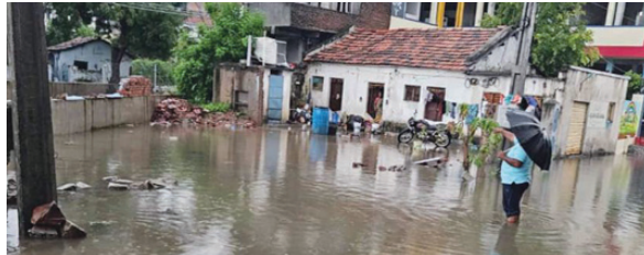
ఉన్నారా పోయిన సంవత్సరం బి వై నగర్ నుండి మొదలుకొని కొత్తచెరువు వరకు కాల్వ నిర్మాణం చేపట్టిన కొత్తచెరువు మత్తడి కింద మాత్రం తాత్కాలికంగా కాలువను తీసి వదిలేయడం జరిగింది. మళ్ళీ ఈ కాల్వ నిర్మాణం గూర్చి మరిచి పోవడం వల్ల శాంతినగర్ శాస్త్రి నగర్ కొత్తచెరువు కింద ఉన్న రోడ్డు ముంపున గురవుతూనే ఉంది. మళ్ళీ వానకాలం వచ్చింది వరదలు వచ్చాయ అంటే సందర్భానికి బయలుదేరుతున్నారు.కానీ శాశ్వత పరిష్కారం చేపట్టడం లేదనేది ముంపుకు గురవుతున్న ప్రజలు అవేదన వ్యక్తం చేస్తున్నారు. ఇకనైనా అధికారులు పాలకవర్గం కనులు తెరిచి శాశ్వతంగా ఎలాంటి వరదలకు గురికాకుండా శాశ్వత పరిష్కారం దిశగా పనులను చేపట్టాలని సిరిసిల్ల పట్టణ ప్రజలు కోరారు.

నిర్లక్ష్యం వల్లనే వరదలు వస్తున్నాయని ఆరోపణలు సిరిసిల్ల, సెప్టెంబర్ 1 (నిఘా న్యూస్): రాజన్న సిరిసిల్ల జిల్లా సిరిసిల్ల పట్టణంలో సిరిసిల్ల మున్సిపల్ పాలకవర్గం నిర్లక్ష్యం వల్లే వరదలు వస్తున్నాయని ప్రజలు ఆరోపించారు. చేస్తూనే ఉన్న పాత బస్టాండ్ నుండి మొదలుకొని సంజీవయ్య నగర్, అనంత నగర్,అశోక్ నగర్, వెంకటేశ, సంజీవయ్య నగర్, ప్రాంతాలలో ప్రజలకు వరద కష్టం తప్పడం లేదు వరదలు వచ్చినప్పుడు మాత్రమే సందర్భానికి వస్తారు.కానీ మళ్ళీ సంవత్సరాలు గడిచిన శాశ్వత పరిష్కారం చూపలేకపోతున్నారు. గత రెండు మూడు సంవత్సరాల నుండి వరదలు వస్తున్నాయి.ప్రజలు నష్టపోతూనే ఉన్నారు. మరి వరదలు వచ్చాయంటేనే పాలకటగా గాని అధికారులకు గానీ కొలువల కాలువ గట్టి గుర్తుకొస్తాయి. వానకాలం పోయిందంటే మళ్ళీ నిద్రమత్తులోకి జారుకుంటారు.అనే సందేహం కలగక మానదు పోయిన పాలకవర్గం తప్పిదాల వల్లే వరదలు వస్తున్నాయి.అంటే వీళ్ళు మీద వాళ్ళు వాళ్ల మీద వీళ్ళు చెప్పుకోవడం తప్ప శాశ్వత పరిష్కారం చూపలేకపోతున్నారు. అనేది ప్రజల వాదన పోయిన వానకాలం వరదల వల్ల ప్రజలకు చాలా నష్టం వాటిల్లింది. అప్పటినుండి ఇప్పటివరకు సంవత్సర కాలం గడిచిన మరి అధికారులే గాని పాలకవర్గమే గాని నిద్రమత్తులోనే