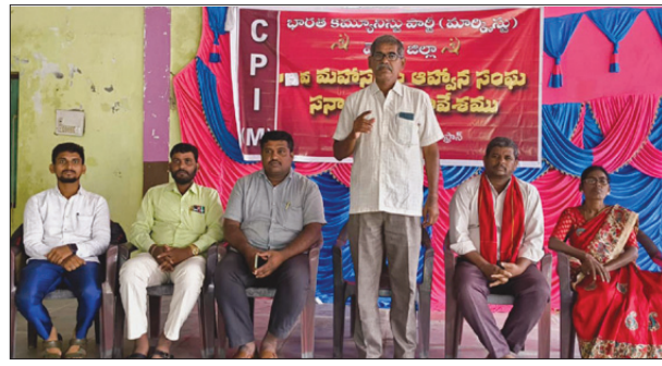
ఈ మహా సభలో మెదక్ జిల్లా ప్రజలు ఎదుర్కొంటున్న సమస్యలపై చర్చ జరిగింది. బిజెపి నిర్వహిస్తున్న మతోన్మాద ప్రజా వ్యతిరేక, కార్మిక విధానాలకు వ్యతిరేకంగా అఖిల భారత స్థాయిలో సిపిఎం పార్టీ పోరాటాల నిర్వహిస్తుందని అదేవిధంగా మెదక్ జిల్లాలో ధూసమస్యల

తూ.ప్రాచీన్, సెప్టెంబర్ 1 (నిఘా న్యూస్): సీపీఎం పార్టీ 15వ జిల్లా మహాసభ సందర్భంగా తూ.ప్రాచీన్ లోని శివ శివని ఫంక్షన్ హాల్ లో 15వ మహాసభల ఆహ్వాన సంఘ సన్నాహక సమావేశం ఏర్పాటు చేయడం జరిగింది. ఈ సమావేశం సిపిఎం పార్టీ జిల్లా కార్యదర్శి వర్ణ సభ్యులు సర్వమూ అధ్యక్షతన నిర్వహించడం జరిగింది. ఈ సందర్భంగా సిపిఎం పార్టీ జిల్లా కార్యదర్శి మాట్లాడుతూ సీపీఎం జిల్లా మహాసభలను నవంబర్ 2, 3, తేదీలలో తూ.ప్రాచీన్ లో నిర్వహించడం జరుగు తున్నదని ఈ మహాసభలు ఆహ్వాన సంఘం అధ్యక్షులలో నిర్వహించడం జరుగుతుందని