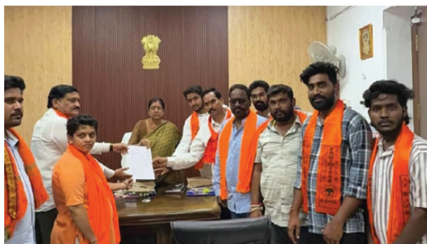
ప్రవేశించి హిందువులు వరమ పవిత్రంగా పూజించే దేవీ దేవతా మూర్తులను చగలగొట్టడం, విరగొట్టడం, శిరచ్ఛేదనం చేసేటటువంటి వ్యక్తులను ఉరితీయాలని డిమాండ్ చేయడం జరిగింది. హనుమకొండ చౌరస్తాలో దిష్టిబొమ్మ దహనం అనంతరం వరంగల్ జిల్లా అదనపు కలెక్టర్,