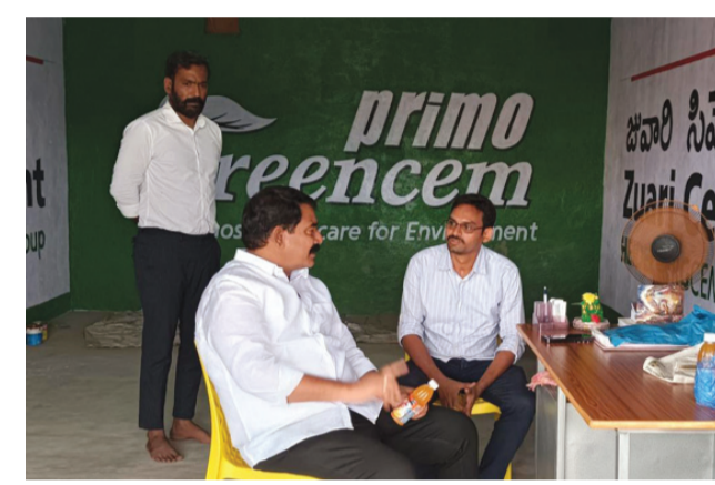
కార్యాలయం ద్వారా గాని సంద్రించి ప్రవేశం పొందవచ్చునని వారు తెలియజేశారు.