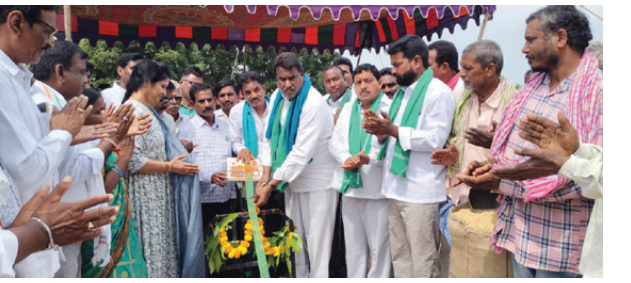
స్వయంగా తీసుకుంటానని తెలిపారు. దీని గురించి ఇప్పటికే వ్యవసాయ

ధర్మపురి, అక్టోబర్ 21 (నిఘా స్వస్థ): నియోజకవర్గం ధర్మపురి మండలంలోని వివిధ గ్రామాలలో ఏర్పాటు చేసిన పది ధాన్యం కొనుగోలు కేంద్రాలను సోమవారం ప్రభుత్వ విప్, ఎమ్మెల్యే అద్దూరి లక్ష్మణ్ కుమార్ రిబ్బన్ కట్ చేసి, తూకం వేసి ప్రారంభించారు. ఈ సందర్భంగా విప్ మాట్లాడుతూ రైతులకు ఎటువంటి ఇబ్బందులు కలగకుండా అధికారులు చర్యలు తీసుకోవాలని, ప్రభుత్వ నియమ నిబంధనలకు అనుగుణంగా పది ధాన్యం కొనుగోలు జరిగే విధంగా చూడాలని, ఎటువంటి ఇబ్బంది ఉన్న తన దృష్టికి తీసుకురావాలని, మార్కెటింగ్ అధికారులు, సూతనంగా నియమితన మార్కెట్ కమిటీ సభ్యులు సమన్వయంతో పనిచేయాలని, రుణమాఫీ వర్తించే రైతులకు రుణమాఫీ జరిగిగా చూసి భాధ్యత తనే