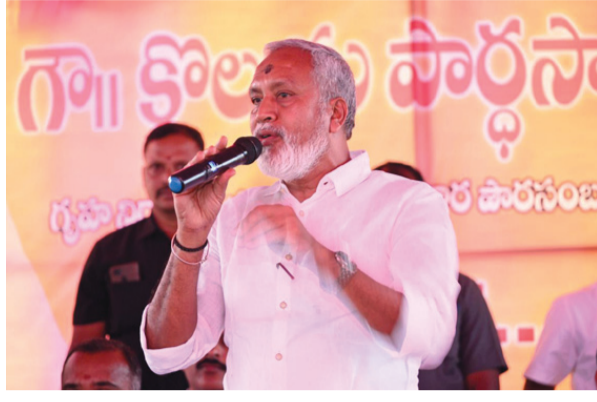
పార్టీ పట్ల ముఖ్యమంత్రి నారా చంద్రబాబు నాయుడు పట్ల చూపే విధేయత తనకెంతో గర్వంగా ఉందన్నారు. చంద్రగిరి ఎమ్మెల్యే పులివర్తి నాని మాట్లాడుతూ ఆవాస ప్రాంతాలకు దూరంగా కాలనీలను ఏర్పాటు చేయటం దురదృష్టకరమని, అయితే దానిని లభిదారుల అదృష్టంగా మార్చడానికి తాము నిరంతరం కృషి చేస్తున్నామన్నారు. ముఖ్యమంత్రి నారా చంద్రబాబు నాయుడు, ఉప ముఖ్యమంత్రి పవన్ కళ్యాణ్, ఐటీ శాఖ మంత్రి నారా లోకేశ్ సహాయ సహకారాలతో చంద్రగిరి నియోజకవర్గం అభివృద్ధికి కృషి చేస్తున్నట్లు తెలియజేశారు.