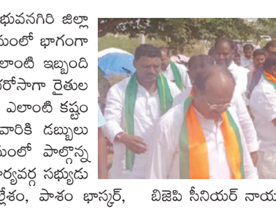
బిజెపి సీనియర్ నాయకులు పాల్గొన్నారు.