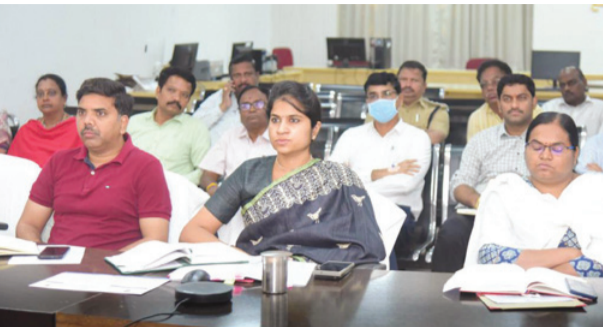
తెలిపారు. సర్వేపై ప్రజల్లో ఎలాంటి అపోహలు ఉండకుండా, సర్వే

సంగారెడ్డి, నవంబర్ 9 (నిఘా న్యూస్): తెలంగాణ రాష్ట్రం దేశంలోనే అతిపెద్ద సమగ్ర కుటుంబ సర్వేను ప్రారంభించింది. ప్రతి ఒక్కరికి అభివృద్ధి, సంక్షేమ కార్యక్రమాలను అందించడానికి అర్బులను లక్ష్యంతో రాష్ట్ర ప్రభుత్వం ఈ సమగ్ర కులగణన సర్వే చేపట్టింది. శనివారం తన క్యాంపు కార్యాలయం నుంచి జిల్లా కలెక్టర్లకు దశ దశా నిర్దేశం చేశారు. ఈ సందర్భంగా ఆయన మాట్లాడుతూ సర్వే ద్వారా ప్రతి కుటుంబానికి సంబంధించిన పథకాలు సేకరించి, అర్బులైన వారికి ప్రభుత్వం చేరేలా చర్యలు తీసుకుంటా మన్నారు. ప్రజలకు ఎలాంటి సందేహాలు ఉండవని