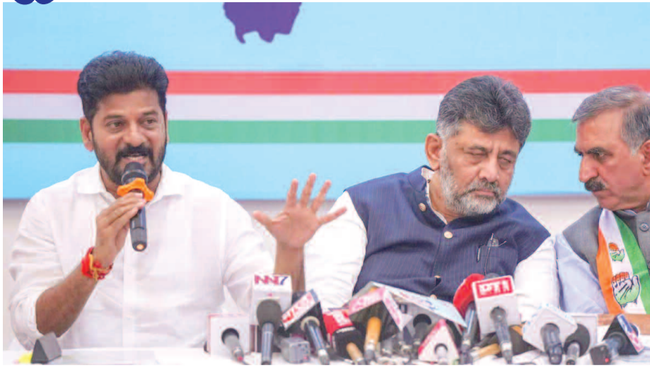
రాష్ట్రంలో కులగణన చేపట్టామని పేర్కొన్నారు. హామీల వివరాలు కావాలంటే ఇవ్వడానికి మేం సిద్ధమని ఈ సందర్భంగా రేవంత్ రెడ్డి ప్రకటించారు. దేశంలోనే ఎక్కువ రైతు అభ్యుదయ మహారాష్ట్రలో నమోదు

పర్యటించారు. ఈ సందర్భంగా ఏర్పాటు చేసిన కాంగ్రెస్ పాటిల రాష్ట్రాల సీఎంల మీటింగ్లో ఆయన మీడియాతో మాట్లాడారు. మహారాష్ట్ర అసెంబ్లీ ఎన్నికల ప్రచారంలో తెలంగాణ ప్రభుత్వం ప్రధాని మోడీ అబద్ధాలు మాట్లాడుతున్నారని విమర్శించారు. తెలంగాణ ప్రభుత్వం అమలు కాని హామీలు ఇచ్చిందని తప్పుడు ఆరోపణలు చేస్తున్నారని ధ్వజమెత్తారు. తెలంగాణలో ఇచ్చిన హామీలన్నీ నేరవేరుస్తామని స్పష్టం చేశారు. రైతులకు హామీ ఇచ్చిన మేరకు 22 లక్షల మంది రైతులకు రూ.17 వేల కోట్ల రుణాలు మాఫీ చేశామని తెలిపారు. రైతులపై ప్రధాని మోడీ వేసిన ప్రత్యేక నేను సమాధానం చెప్పాక ఆయన పోస్ట్ డిబిట్ చేశారని అన్నారు. తెలంగాణలో అధికారంలోకి వచ్చిన 10 నెలల్లోనే 50 వేల ఉద్యోగాలు ఇచ్చామని గర్వం చేశారు. రైతులకు సన్న వడ్డకు క్వింటాకు రూ.500 బోనస్ ఇస్తున్నాం.. సామాజిక న్యాయం కోసం