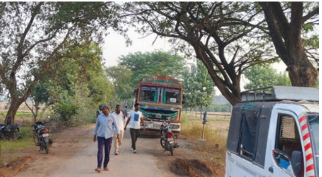
సంబంధిత అధికారులు చర్యలు తీసుకోవడం లేదనే అనుమానాలను ఆ గ్రామాల ప్రజలు వ్యక్తం చేస్తున్నారు. ఇసుక అక్రమ రవాణా, ఓవర్ లోడింగ్ వల్ల ప్రభుత్వ ఆదాయానికి గండిపడుతున్నా, ఓవర్ లోడింగ్ తో వెళ్లే భారీ వాహనాల వల్ల రోడ్డు దెబ్బతిని ఇబ్బందులకు గురవుతున్నా వట్టింతుకోరా అని అధికారులను ప్రశ్నించారు. ఇప్పటికైనా ఇసుక అక్రమ రవాణాను సు అరికట్టేందుకు సంబంధిత శాఖల అధికారులు వెంటనే కట్టుదిట్టమైన చర్యలు తీసుకోవాలని, అలాగే ఓవర్ లోడింగ్ ను నియంత్రించాలని, తనిఖీలు ముమ్మరం చేయాలని ఊటూరు, పచ్చన్నూరు గ్రామాల ప్రజలు కోరుతున్నారు. లేనివట్లలో తమ ఆందోళనను తీవ్రతరం చేస్తామని వారు హెచ్చరించారు.

కరీంనగర్, డిసెంబర్ 10 (నిఘా సూన్య): కరీంనగర్ జిల్లా మానకొండూర్ మండలంలో ఇసుక అక్రమ రవాణాపై ఊటూరు గ్రామస్థులు కన్నెర్ర జేశారు. ఊటూరు క్వారీ నుంచి పెద్ద ఎత్తున ఓవర్ లోడింగ్ తో ఇసుక అక్రమ రవాణా వల్ల ప్రభుత్వ ఆదాయానికి గండిపడటమే కాకుండా రోడ్డు దెబ్బతింటున్నా యందుగా గ్రామస్థులు ఆందోళన చేస్తున్నారు. సోమవారం నుంచి చేపట్టిన ఈ ఆందోళన మంగళవారం కొనసాగింది. దీంతో ఇసుక లారీల రాకపోకలు స్తంభింపిపోయాయి. ఊటూరు-పచ్చన్నూరు గ్రామాల మధ్య వందలాది ఓవర్ లోడ్ తో ఉన్న లారీలతో పాటు లోడింగ్ కోసం వెళ్లే లారీలు, ట్రాక్టర్ల రోడ్డుపై నిలిచిపోయాయి. ఇసుక అక్రమ రవాణా గురించి ముఖ్యంగా అధిక లోడ్ తో జరుగుతున్న ఇసుక రవాణా గురించి పలుమార్లు సంబంధిత అధికారుల దృష్టికి తీసుకు వచ్చినా ఎవరూ పట్టించుకోలేదని తో ఊటూరు, పచ్చన్నూరు గ్రామస్థులు ప్రజలు ఆగ్రహం వ్యక్తం చేస్తున్నారు. సోమవారం నుంచి చేపట్టిన ఆందోళన గురించి సమాచారం ఉన్నప్పటికీ పోలీసులు, రెవెన్యూ అధికారులుగాని, మైనింగ్ అధికారులు గాని ఇప్పటి వరకు ఇటు వైపు రాకపోవడం నుంచి వారు తీవ్ర ఆగ్రహం వ్యక్తం చేస్తున్నారు. ఇసుక మాఫియాదారుల నుంచి మామూళ్ల పుచ్చుకోవడం వల్లనే వారిపై