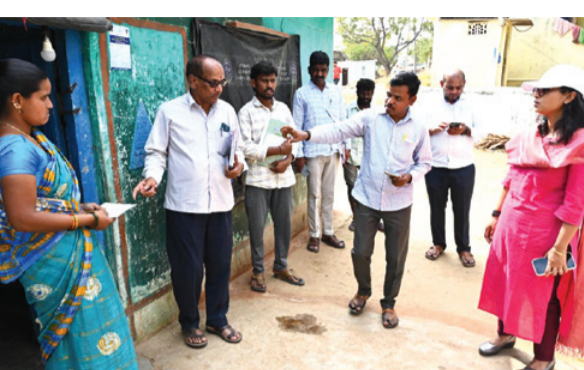
సమాచారం ఇచ్చి ఒకరోజు ముందే టాం 8% వేయించి సర్వేకు వెళ్లాలని కలెక్టర్ సూచించారు. ఉదయం, సాయంత్రం వేళల్లో సర్వే చేస్తే ప్రజలు అందుబాటులో ఉంటారని ఆమె చెప్పారు. మద్యూర్ మండల