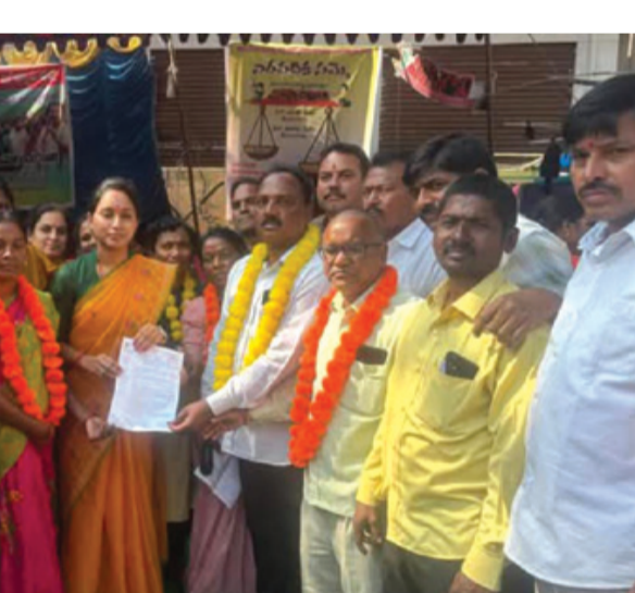
చేసినప్పుడు అప్పుడు పిసిసి హెరాలో ఉన్న రేవంత్ రెడ్డి సమ్మె శిబిరానికి వచ్చేసి కాంగ్రెస్ ప్రభుత్వం అధికారంలోకి వస్తే టీ తాగే సమయంలో సమగ్ర శిక్ష ఉద్యోగులందరినీ రెగ్యులర్ చేపించి అందరికీ టీ తాగించి పంపిస్తామని హామీని ఇవ్వడం జరిగింది. కానీ కాంగ్రెస్ ప్రభుత్వం అధికారంలోకి వచ్చి సంవత్సరం గడిచినప్పటికీ సమగ్ర శిక్ష ఉద్యోగులను రెగ్యులర్ చేయకపోవడంతో సీఎం ఇచ్చిన హామీని వెంటనే అమలు చేయాలని, ఖాళీ