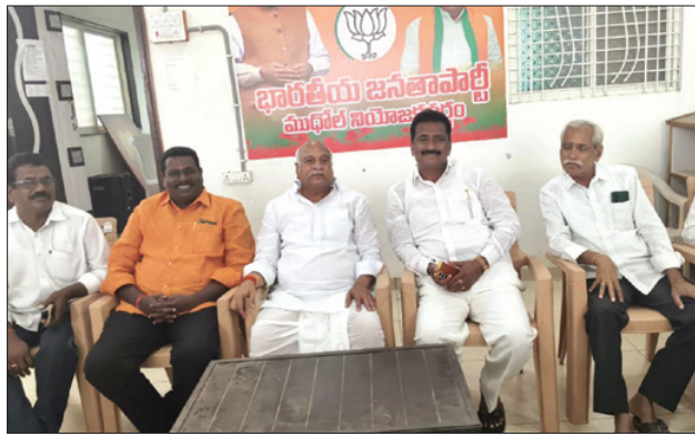
లిట్టి ఇరిగేషన్ పనులను యుద్ధ ప్రాతిపదికన చేపడతామన్నారు. కుబీర్ లో 132 /11 కె.వి.నల్ స్టేషన్, కోలార్, మహోగా, పట్టి, గ్రామాల్లో 33/11 కె.వి.నల్ స్టేషన్ లు ఏర్పాటు చేస్తామన్నారు. నియోజకవర్గంలో ఉన్న 190 చెరువులకు మరమ్మత్తులు చేయడానికి నిధులు ఇవ్వాలని కోరినట్లు చెప్పారు.

ముద్గోల్, డిసెంబర్ 24 (నిఘా న్యూస్): శ్రీరామ్ సాగర్ ప్రాజెక్టు పునరవాస గ్రామస్థులందరికీ ఇళ్ల స్థలాలకు పట్టాలు ఇచ్చేందుకు ప్రత్యేక దృష్టి సారించినట్లు ఎమ్మెల్యే పవార్ రామారావు పబ్లిక్ తెలియజేశారు. ఖైంసా లోని ఎస్.ఎస్.జి.సింగ్ ఫ్యాక్టరీ లో మంగళవారం ఏర్పాటు చేసిన విలేజ్ కలల సమావేశం లో ఆయన మాట్లాడారు. సంవత్సరాల తరబడి అప్పటి ప్రభుత్వం స్థలాలు ఇచ్చినప్పటికీ హక్కు వ్రాతలు లేకపోవడంతో రుణాలు కావాంట్లే ప్రజలు ఇబ్బందులు పడుతున్నారన్నారు. ఈ విషయమై రెవెన్యూ శాఖ మంత్రి దృష్టికి తీసుకువచ్చినట్లు చెప్పారు. 50వేల ఎకరాలకు సాగునీరు అందించడమే లక్ష్యంగా కాలేక్షన్ల 28 ప్యాకేజీ పనులకు 320 కోట్ల రూపాయలు నిధులు ఇవ్వాలని, గడ్డెన్న వాగు ప్రాజెక్ట్ సి.సి.లైనింగ్ పనులకు 50 కోట్లు, గుండెగాం పునరావాసానికి నిధులు ఇవ్వాలని మంత్రి ఉత్తమ కుమార్ రెడ్డి దృష్టికి తీసుకెళ్తానని చెప్పారన్నారు. ఏరియా ఆసుపత్రి పై ప్రత్యేక దృష్టి సారించడం జరిగిందని, అప్పట్లో 16 మంది డాక్టర్లు ఉంటే ప్రస్తుతం 32 డాక్టర్ల నియమించడం జరిగింద న్నారు. ఏరియా ఆసుపత్రికి 150 పడకల ఆసుపత్రిగా మారుస్తామన్నారు. బ్రహ్మాణి గావ్ లిట్టి ఇరిగేషన్, పిట్టి