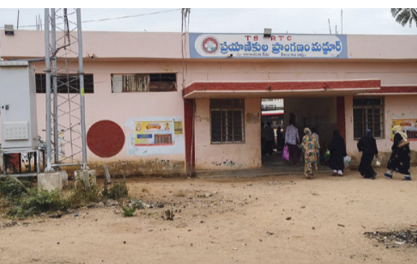
దుర్భాగ్యులకు వస్తున్నాయని ప్రయాణికులు మండి పడుతున్నారు. సీఎం సొంత నియోజకవర్గంలో ఉన్న ఈ ఆర్టీసీ బస్టాండ్ దుర్భాగ్యులతో నిండిపోవడంతో ప్రజాసంఘాల నాయకులు, పలువురు విమర్శలు గుప్పిస్తున్నారు. ఆర్టీసీ అధికారులకు ఈ బస్టాండ్ పర్యవేక్షణకు కనమరుగైందని, పండుల బెడద