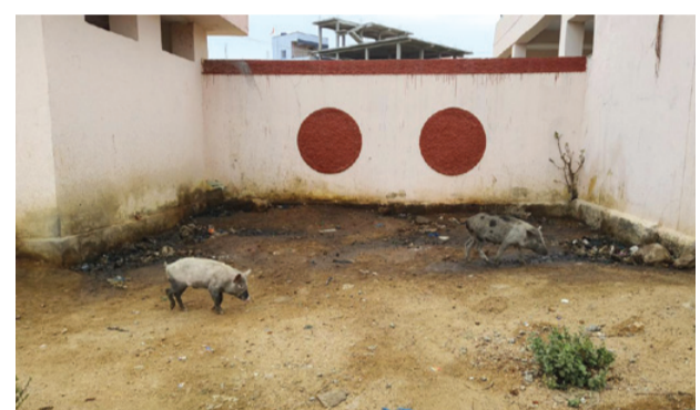
దుర్భాగ్యులతో నిండిపోయిన ఈ బస్టాండ్ ను పట్టించుకునే నాధుడే లేదని, ప్రయాణికులు స్థానికులు తెలిపారు. ఆర్టీసీ, సంబంధిత అధికారులు వెంటనే స్పందించి మూత్రశాలలు మరుగుదొడ్లు, పరిశుభ్రంగా ఉండేట్లు చూడాలని ప్రయాణికులు, ప్రజాసంఘాల నాయకులు కోరుతున్నారు.