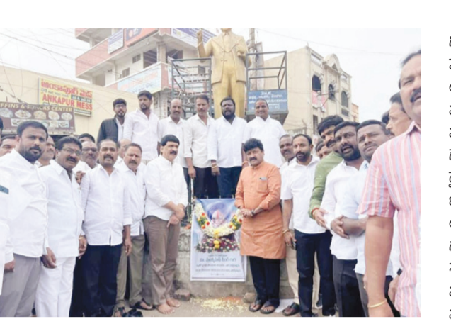
నెరవేర్చేందుకు కాంగ్రెస్ కార్యకర్తలందరం పునరంశిత మవుదామని తెలిపారు. ఈ కార్యక్రమంలో మేడ్చల్ మండల కాంగ్రెస్ పార్టీ అధ్యక్షులు