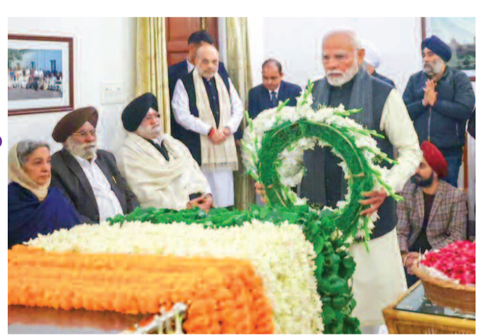
నా గురువును కోల్పోయాను: రాహుల్ గాంధీ మన్మోహన్ కు సోనియా, రాహుల్ నివాళి ఖర్గే తదితరులు శ్రద్ధాంజలి నేడు ఏఐసీసీ కార్యాలయానికి పార్థివ దేహం 2

న్యూఢిల్లీ డిసెంబర్ 27 (నిఘా న్యూస్): భారత మాజీ ప్రధాని, కాంగ్రెస్ సీనియర్ నేత మన్మోహన్ సింగ్ పార్థివదేహానికి ప్రధాని మోదీ, హెంజులకాని మంత్రి అమిత్ షా, బిజెపి జాతీయ అధ్యక్షుడు జెపి నద్దా తదితర ప్రముఖులు నివాళులర్పించారు. ఆయన కుటుంబసభ్యులకు ప్రగాఢ సానుభూతి తెలిపారు. మన్మోహన్ సింగ్ మృతిపై రాజకీయ, సినీ ప్రముఖులు సంతాపం తెలిపారు. మాజీ ప్రధాని మన్మోహన్ సింగ్ కన్ను మూయడంతో దేశ ప్రజలు శోకసంద్రంలో మునిగిపోయారు. ఆయన పార్థివదేహానికి రాష్ట్రపతి ద్రౌపదీ ముర్ము ప్రధాని సర్వమోదీ నివాళులర్పించారు. శుక్రవారం ఉదయం మన్మోహన్ నివాసానికి వెళ్లి ఆయన భౌతికకాయం పద్ద అంజలి పోతించారు. ఆయన కుటుంబసభ్యులకు ప్రగాఢ సానుభూతి తెలిపారు. అనంతరం ప్రధాని మోదీ మాట్లాడుతూ 'ఆర్థికవేత్తగా, సంస్కరణల సారథిగా మన్మోహన్ సింగ్ ను దేశం గుర్తుంచుకుంటుంది. ఆర్.బీ.ఐ గవర్నర్ సహా అనేక కీలక పదవుల్లో దేశానికి సేవలందించారు. పీవీ హయాంలో ఆర్థికమంత్రిగా దేశ ఆర్థిక ముఖచిత్రాన్ని ..మిగతా 2లో