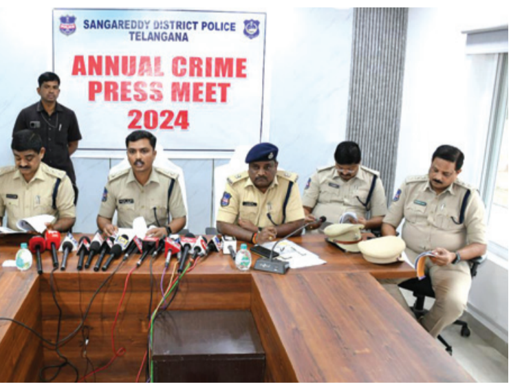
కోట్లు రికవరీ చేయడం జరిగిందని తెలిపారు. జిల్లాలో మారకద్రవ్యాల నిరోధానికి చర్యలు చేపట్టడం, ప్రతిరోజూ నిఘా ఏర్పాటు చేశామన్నారు. గణజాయి స్పర్టింగ్ మూలాలను చేదించి, అక్రమ రవాణాను అరికట్టడం జరిగిందని తెలిపారు. ఆధునిక టెక్నాలజీ వాడకం ద్వారా 739 సీసీ డీపీ కెమెరాల ఏర్పాటు చేశామని తెలిపారు. సిబిఆర్ పోస్టల్ ద్వారా మొత్తం క్రైమాంగ్ చేసి అందించడం జరిగిందన్నారు. ప్రజల భద్రత మా ప్రథమ ప్రాధాన్యం. ప్రతి పోలీస్ అధికారి మరింత సమర్థవంతంగా సేవలు అందించేలా అన్ని రకాల చర్యలు చేపట్టడం జరిగిందని పేర్కొన్నారు.జిల్లా ప్రజలకు సూతన సంవత్సర శుభాకాంక్షలు తెలిపారు.

సంగారెడ్డి, డిసెంబర్ 27 (నిఘా స్వ్యాస్): జిల్లాలో ప్రజల సంరక్షణ భద్రత ప్రథమ కర్తవ్యంగా భావిస్తూ అనేక చర్యలు అమలు చేస్తున్నామని జిల్లా ఎస్పీ చెన్నూరు రూపేష్ తెలిపారు. శుక్రవారం జిల్లా ఎస్పీ కార్యాలయంలో మీడియాతో మాట్లాడుతూ 2024 సంవత్సరంలో క్రైమ్ కంట్రోల్ వివరాలను వెల్లడించారు. ముఖ్యంగా సైబర్ నేరాలు, రోడ్డు ప్రమాదాలు, మహిళల భద్రతకు సంబంధించి ప్రత్యేక ప్రణాళికలు పేర్కొన్నారు. సమాఖ్యలో శాంతిని నెలకొల్పడం, ప్రజల ధన, మాన రక్షణ కోసం పోలీసులు అహర్నితలు కృషి చేస్తున్నారని తెలిపారు. అందరం సమన్వయంతో క్రైమ్ కంట్రోల్ చేయడం జరిగిందని పేర్కొన్నారు.కమ్యూనిటీ పోలీసింగ్ ద్వారా ప్రజలకు మరింత చేరువవుతూ అవగాహన కార్యక్రమాలను నిర్వహిస్తున్నామన్నారు. మహిళల భద్రతకు కట్టుబట్టమైన చర్యలు చేపట్టడం జరిగిందని తెలిపారు. ఓ-టీం టెలిఫోన్ విద్యుత్తులు చేయటం,లాభిత మహిళలకు రూ.36.87 లక్షల నష్ట పరిహారం అందించామని పేర్కొన్నారు. 168 ఓ.టి.సో కేసుల పరిష్కారం, 8 మంది నేరపరులకు శిక్షలు విధించడం జరిగిందన్నారు. సైబర్ సెల్ ఏర్పాటు ప్రజల్లో అవగాహన కార్యక్రమాలను నిర్వహించడం జరిగిందన్నారు. వివిధ ఆర్థిక నేరాలలో మోసపోయిన బాధితులకు 47.84 కోట్లరూపాయల్లో, 5.90