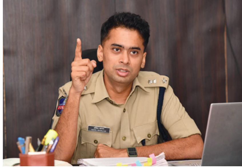
ఎర్రాబుల చేసే ఎలాంటి కార్యక్రమాలు ఆయన సరే నిర్వహించుకు తప్పని సరిగా పోలీసు అధికారులు నుండి ముందస్తు అనుమతులు తీసుకోవాలని, అలాగే ప్రజలకు ఇబ్బందులకు గురిచేసే విధంగా నిబంధనలకు విరుద్ధంగా డి జే లు, అధిక శబ్దం వచ్చే బాక్స్ లు ఏర్పాటు

రాజన్న సిరిసిల్ల, డిసెంబర్ 29 (నిఘా న్యూస్): సంతోషాల నడుమ నూతన సంవత్సర వేడుకలు నిర్వహించుకోవాలని జిల్లా ఎస్పీ ప్రజలకు సూచించారు. నూతన సంవత్సర వేడుకల సమీపిస్తున్న వేళ జిల్లా పరిధిలోని ప్రజలు ప్రశాంతమైన వాతవరణంలో ఎలాంటి అవాంఛనీయ సంఘటనలు జరగకుండా పోలీస్ శాఖ తరఫున భద్రత ఏర్పాటు చేయడం జరుగుతుందని తెలిపారు. డిసెంబర్ 31రోజున జిల్లా వ్యాప్తంగా పట్టణ, గ్రామీణ ప్రాంతాల్లోను ముమ్మరంగా డ్రంక్ అండ్ డ్రైవింగ్ తనిఖీలు నిర్వహించబడుతాయని, నూతన సంవత్సర వేడుకలు సందర్భంగా