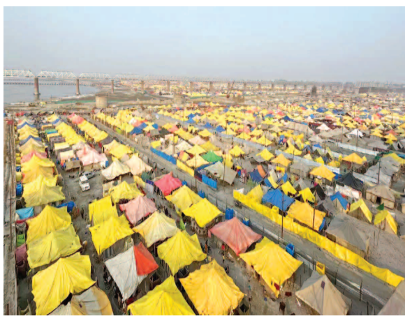
అయోధ్యకు భారీగా భక్తులు తరలి రానున్నారు. దీంతో ఎలాంటి నిర్వహణ లోపాలు తలెత్తకుండా అధికారులు విస్తృత ఏర్పాట్లు చేస్తున్నారు. అయోధ్య రామ మందిర దర్శన వేళలు పెంచుతూ రామ జన్మభూమి తీర్థ క్షేత్రాల్ని నిర్ణయం తీసుకుంది.

అయోధ్య డిసెంబర్ 29 (నిఘా స్పెషల్): మహా కుంభమేళా కోసం అయోధ్య నగరం ముస్తాబవుతోంది. వచ్చే ఏడాది రామమందిరం ప్రారంభోత్సవం తర్వాత తొలిసారి మహా కుంభమేళా జరుగుతుండడం వల్ల అయోధ్యను అందంగా తీర్చిదిద్దుతున్నారు. నూతన ఏడాదిలోకి అడుగుపెట్టడం, బాల రాముడు కొలువుదీరి సంవత్సరం పూర్తి కావస్తుండటంతో పెద్దసంఖ్యలో భక్తులు తరలి వచ్చే అవకాశాలు ఉంది. అందుకే ఎలాంటి నిర్వహణ లోపాలు తలెత్తకుండా అధికారులు విస్తృత ఏర్పాట్లు చేస్తున్నారు. నూతన ఏడాది, మహా కుంభమేళా పురస్కారంకోసం అయోధ్య నగరం అందంగా ముస్తాబవుతోంది. జనవరి 13 నుంచి ఫిబ్రవరి 26 వరకు 44 రోజుల పాటు ఉత్తరప్రదేశ్లోని ప్రయాగ్ గాజోల్ జరిగే మహా కుంభమేళా కోసం అక్కడి ప్రభుత్వం విస్తృత ఏర్పాట్లు చేస్తోంది. ఈ కుంభమేళా కోట్ల మంది ప్రజలు తరలిరానున్నారు. కుంభమేళాకు వచ్చిన ప్రజలు అయోధ్య బాలరాముడి దర్శనానికి వచ్చే అవకాశాలు ఉన్నాయి. రామమందిర ప్రారంభోత్సవం తర్వాత తొలిసారి కుంభమేళా జరుగుతుండడం వల్ల అయోధ్యలోనూ ముమ్మరంగా ఏర్పాట్లు చేస్తున్నారు. అదే సమయంలో నూతన ఏడాదిలోకి అడుగుపెట్టడం, బాలరాముడు కొలువుదీరి సంవత్సరం పూర్తి కావస్తుండటంతో