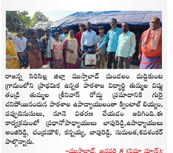
-ముస్తాబాద్, జనవరి 8 (నిఘా న్యూస్):