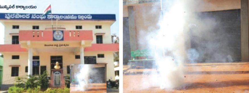
పాలకవర్గం చేసిన చెత్త పనులకు ఆయన సహకరించారు. అంటూ అందర్నీ బాగాస్వాములు చేస్తూ చెప్పకనే చెబుతున్నట్లు చెప్పడం విద్యారంగా ఉండవచ్చు. పాలకవర్గం చేసిన చెత్త పనులకు నిదర్శనం 19 వ వార్షికోత్సవం పట్టణ ప్రకృతి పంపం ఒకటి చాలు కళ్ళకు కనబడటంట్లు ఉంది పాలకవర్గం అవినీతి అంటూ ఎద్దేవా చేసిన సంఘాలు, మైక్ ముందు కూర్చొని అభివృద్ధి చేశామని గొప్పలు చెప్పుకోవడం పాలకవర్గానికి మాత్రమే చెబుతూలు అవుతుందన్నారు. ఐదేళ్ల అసమర్థత పాలన బుగ్గ వారులో పేరకపోయిన చెత్తలా ఉండవచ్చు.

ఇల్లంప, జనవరి 26 (నిఘా స్కాన్): ఇల్లంప మున్సిపల్ పాలకవర్గం నేటితో కాలం ముగియనుండటంతో పట్టణ వాసులు టిపాసులు కాలుస్తూ ఆసందాన్ని వ్యక్తపరిచారు. ఐదేళ్లలో పాలకవర్గం అడుగుడుగులు అవినీతిమయంతో అడింది అంటూ పొడిపి పాటగా సాగించారన్నారు. బందుపర్ణానికి కాంట్రాక్టు పనులు ఇస్తూ బిల్లులు వేసు వెంటనే చేయించు కోవడంతో కీలకంగా వ్యవహరించిన పాలకవర్గం అంటూ ఆదివాసి సంఘాలు ఆరోపణలు చేశాయి. 2020 గణేష్ నవరాత్రులు బతకవూ, దసరా ఉత్సవాల పేరిట చేసింది కొంత బిల్లులు చెల్లి రోదించి కొందరి ప్రతి సంవత్సరం ఇదే తంతు అంటూ సంఘాలు పేర్కొన్నాయి , ప్రతి పనికి కమిషన్ల దండా. కాంట్రాక్టు పనులకు పర్సంటేజీ లు పుస్తకపోవడం ఐదేళ్లగా కొనసాగించా రన్నారు.