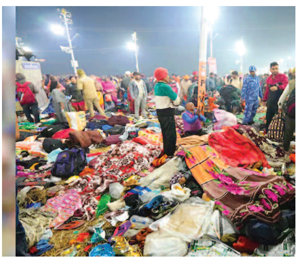
గాయపడినవల్ని వివరించారు. మరో ప్రత్యక్ష సాక్షి మాట్లాడుతూ ఈ ప్రాంతం నుంచి బయటకు వెళ్లే మార్గాలు పూర్తిగా మూసుకుపోయాయి.

వరకు ఆ సంఖ్య పెరిగి అవకాశాలు ఉన్నాయి. మౌని అమావాస్య కారణంగా నెలకొన్న రద్దీతో తొక్కినవలలు ఘటన చోటుచేసుకొని పదుల సంఖ్యలో భక్తులు ప్రాణాలు కోల్పోయినట్లు తెలుస్తోంది. అనేకమంది గాయపడ్డారు. ఆ భయనక కక్షలను కొంతమంది ప్రత్యక్ష సాక్షులు విరిడియాతో పంచుకున్నారు. వివరీతమైన రద్దీ వల్ల ఎటు వెళ్లాలో తెలియక గందరగోళ పరిస్థితి నెలకొంది తెలిపారు. చీకట్లో కన్పించని చెత్త బుట్టలు కాళ్లకు తగలడంతో చాలామందికి కింద పడిపోయారని పేర్కొన్నారు. తెల్లవారుజామున 2 గంటల ప్రాంతంలో ఈ ఘటన చోటుచేసుకుంది. మౌని అమావాస్య నేపథ్యంలో త్రివేణి సంగమం వద్ద పుణ్యస్థానాలు చేసేందుకు ఒక్కసారిగా భక్తులు బయల్దేరారు. తలపై పెద్దపెద్ద లగ్జరీలతో భక్తులు తరలివచ్చారు. అయితే, ఎటునుంచి వెళ్లాలి, ఎక్కడ స్నానమాచరించాలన్న దానిపై ఎవరికీ అవగాహన లేదు. పైగా యాత్రికుల కోసం ఈ ప్రాంతంలో పెద్ద సంఖ్యలో ఇసుప చెత్త డబ్బాలను ఏర్పాటుచేశారు. చివ్వుచీకట్లో అవి ఎవరికీ కన్పించలేదు. దీంతో వాటికి తగిలి చాలామంది కింద పడిపోయారు. ఈ క్రమంలోనే తొక్కినవలలు జరిగింది" అని ప్రత్యక్ష సాక్షి ఒకరు తెలిపారు. చెత్త డబ్బు తగిలి కాను కూడా కింద పడిపోయామని, ఎలాగోలా అక్కడినుంచి కుటుంబంతో బయటపడ్డానని చెప్పారు. వేరే భక్తులను కాపాడే క్రమంలో స్వల్పంగా