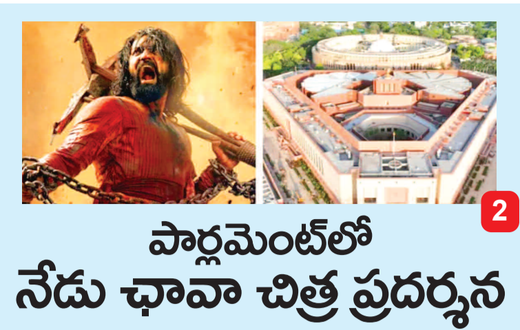
పార్లమెంట్లో నేడు ఛావా చిత్ర ప్రదర్శన

Published from : Hyderabad, Karimnagar, Nizamabad, Warangal, Vijayawada, Tirupati, Kurnool, Visakhapatnam