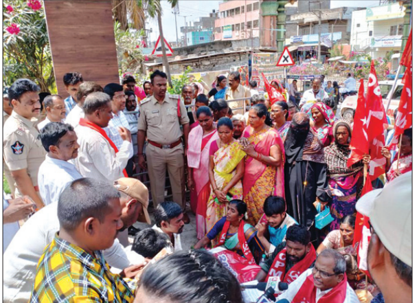
ఎదుర్కొన్నాయి. ఒకపార్టీ వక్స్ చేయబడిన ఆస్తులు శాస్త్రంగా వక్స్ ఆస్తులుగా ఉంటాయని వాటి స్వభావాన్ని మార్చి అధికారం ఎవరికి లేదని సుప్రీంకోర్టు తీర్పుకు వ్యతిరేకంగా ఈ చట్టం చేయబడింది. భారత రాజ్యాంగంలోని 25, 29, 30 తదితర నిబంధనల వ్యతిరేకంగా ఈ చట్టం చేయబడింది. మసీదులు, ధర్మాలు, న్యూనాలు ఇప్పుడు మరింత ప్రమాదంలో పడతాయి. లక్షల ఎకరాల వక్స్ ఆస్తులు కొల్ల గొట్టబడతాయి.

కడప, ఏప్రిల్ 3 (నిఘా న్యూస్): పార్లమెంటులో బిజెపి కేంద్ర ప్రభుత్వం లౌకిక విలువలను మంట కలుపుతూ, మైసూర్ల హక్కులను హరిస్తూ, వక్స్ చట్ట సవరణ చేస్తూ, పార్లమెంటులో ఆమోదించే చేసుకోవటం రాజ్యాంగ వ్యతిరేక చర్యలన్నారు. భారత కమ్యూనిస్టు పార్టీ (మార్క్సిస్ట్), సీపీఎం కడప జిల్లా కమిటీ సందర్భంగా వ్యతిరేకిస్తోందని తెలిపారు. కేంద్రంలోని సరేంద్ర మోడీ బిజెపి మైసూర్ ప్రభుత్వం తన హిందూత్వ మతోన్మాద ఎజెండా అమలులో భాగంగా బిజెపి కేంద్ర ప్రభుత్వం ముస్లిం ప్రజలపై విద్వేషాన్ని చిహ్నాలుగా అనేక దాడులు చేస్తున్నది. లవ్ జిహాద్, ఘనాషనీ, కామన్ సివిల్ కోడ్, మసీదుల విధ్వంసం, మూక హత్యలతో హిందూత్వ ఉన్మాద శక్తులు తల వదులుతున్నాయి. ఇప్పుడే సరికొత్తగా సవరణ చట్టం ద్వారా ముస్లింల ధార్మిక, సామాజిక, సాంస్కృతిక సంస్థలపై దాడి తలపెట్టింది. ఈ చట్టం ఆస్తుల కట్టా చేయడానికి తప్ప, వాక్యీఆస్తులు అభివృద్ధికి కాదు. దుర్భరమైన సవరణలు చేస్తూ ముస్లిం ప్రజల ఆస్తులపై యుద్ధం ప్రకటించే ఈ చట్టం లౌకికతను పూర్తిగా నశిస్తూ, జనసేనతో సహా మరెవరినీ పార్టీలు తమ స్వార్థ ప్రయోజనాలకై బలపరచడంతో 2025 ఏప్రిల్ రెండవ తేదీ నిన్న ఈ బిల్లు ఆమోదం పొందింది. దీనికి జనసేనల వైఖరి లౌకికత్వానికి విఘాతం కలిగించాయి. సీపీఎం సహా ప్రతిపక్షాలు ఈ బిల్లును పార్లమెంటులో గట్టిగా