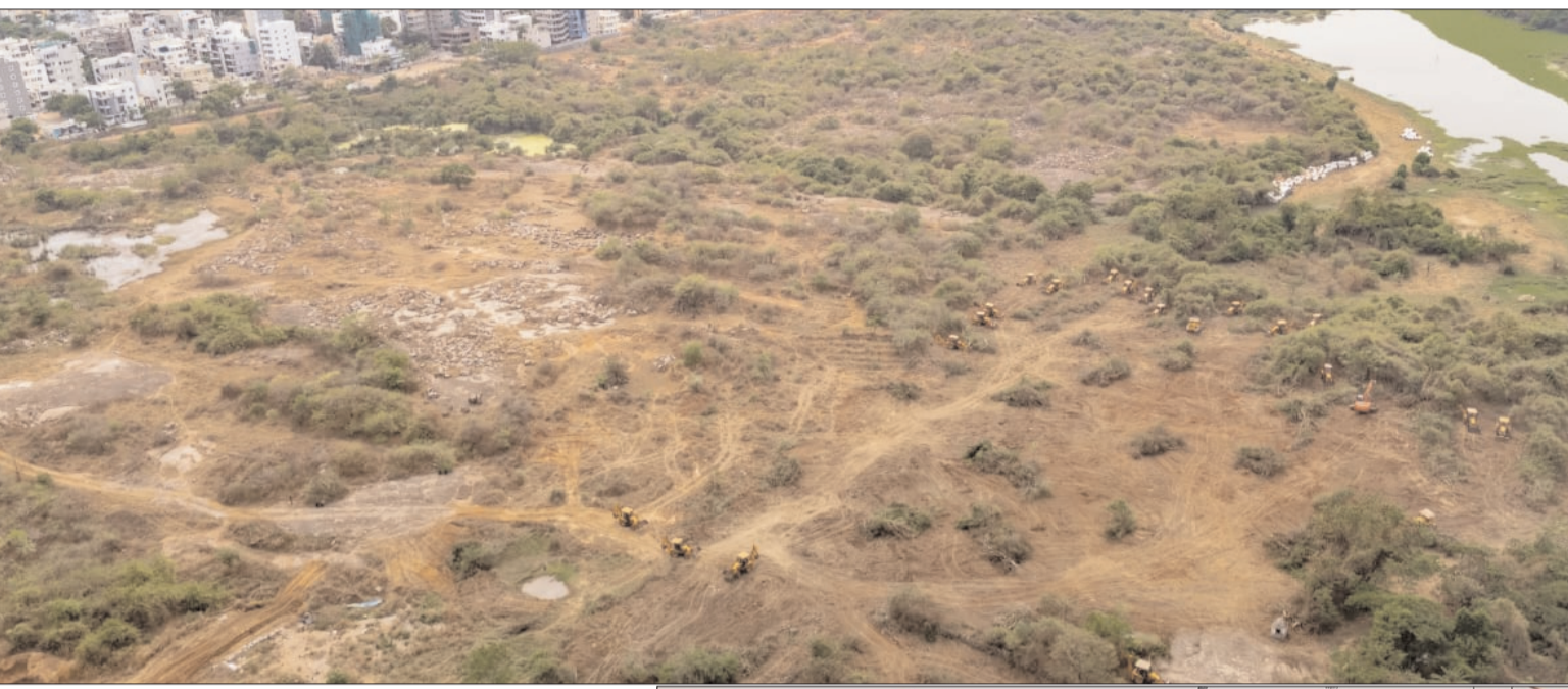
తేలింగంపల్లి మార్చి 31 (నిఘా స్టూన్)

ప్రభుత్వ భూములు అమ్మడమేనా..? ప్రజాస్వామ్యబద్ధంగా నిరసన వ్యక్తం చేస్తున్న విద్యార్థులపై లాఠీల దెబ్బలు, కేసులతో బెదిరింపు విద్యార్థులు రాకుండా గేట్లకు తాళాలు -పహారా కాస్తున్న వేలాది పోలీసులు