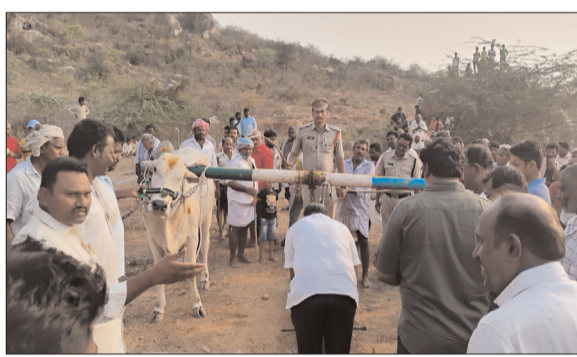
బెల్లంకొండ మార్చి 31 (నిఘా స్టూన్)